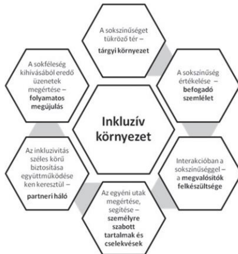
5. ábra. Az inkluzív rendszer működtetési feltételei