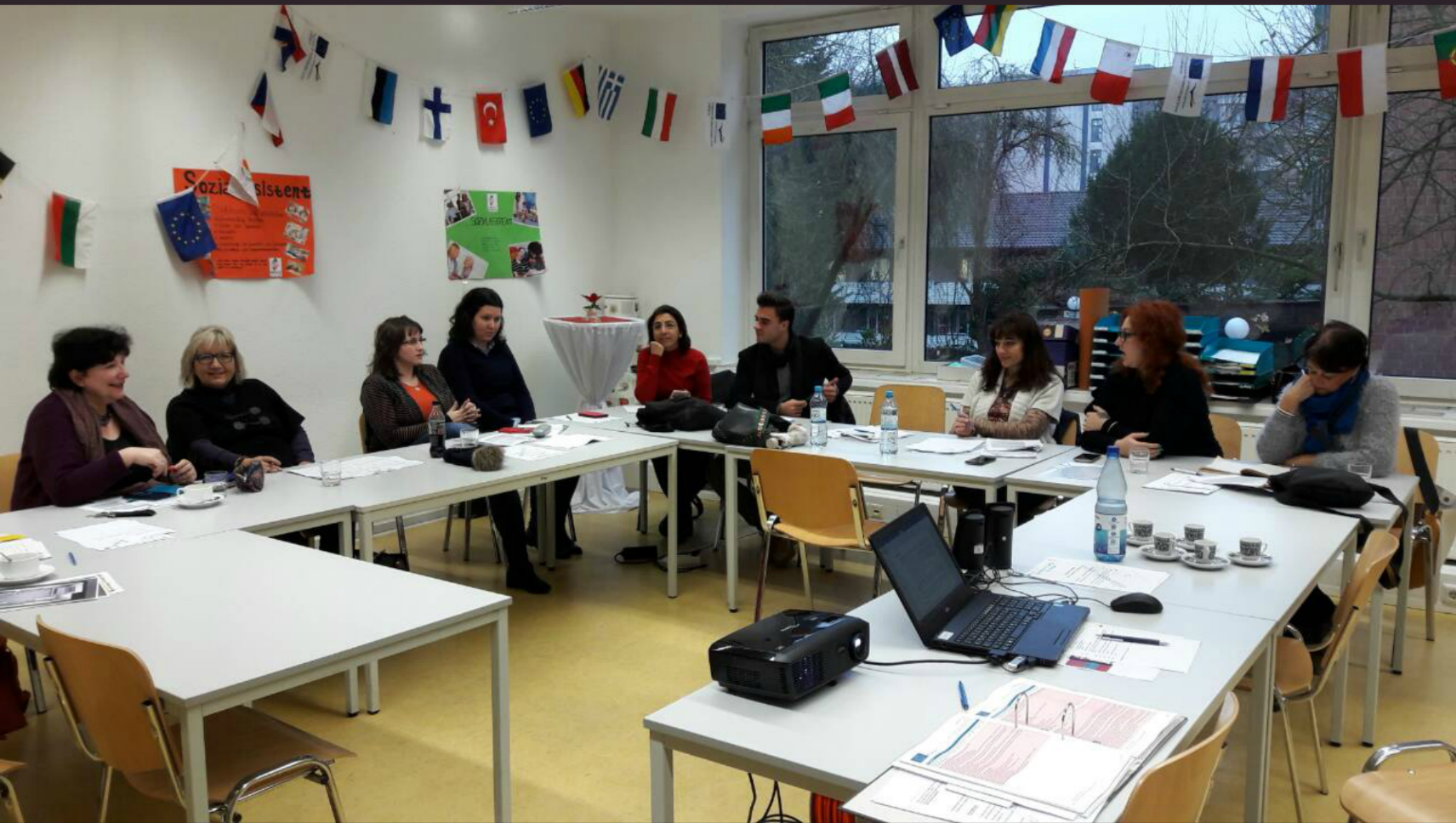
A projekt rövid tartalma